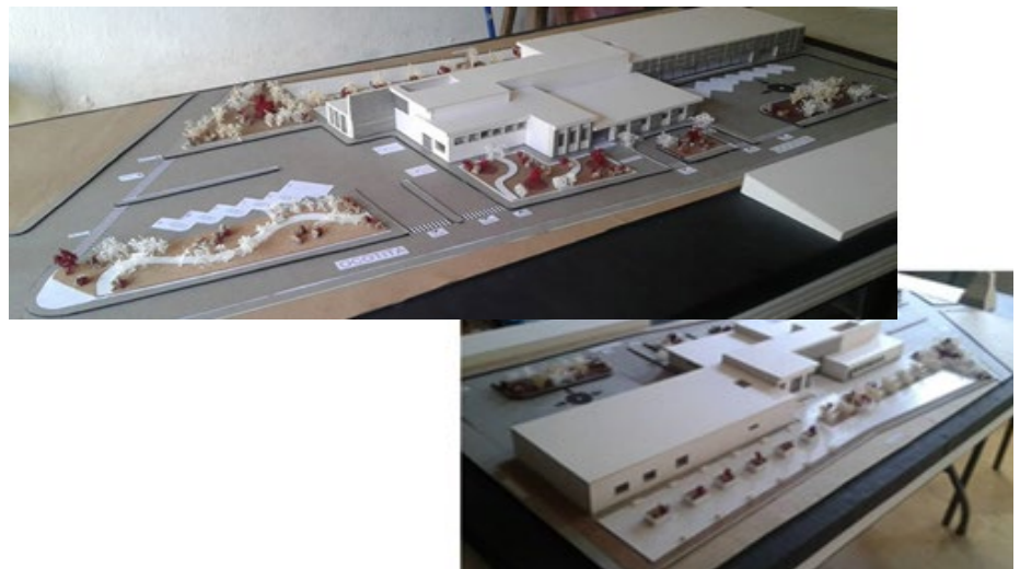
Figura 9. Clínica de primer nivel (Tipo A) –Maqueta

“La propuesta de rehabilitación y ampliación del Palacio Municipal surge a partir de la necesidad y falta de espacios y/o lugares con los que cuenta actualmente dicho establecimiento; por lo que normalmente genera confusiones para las personas que radican en el municipio, así como los foráneos; de manera que también denotan los trabajadores una incomodidad referente a la falta de cubículos para realizar sus actividades y no afectar el trabajo de terceros” (González Lucido