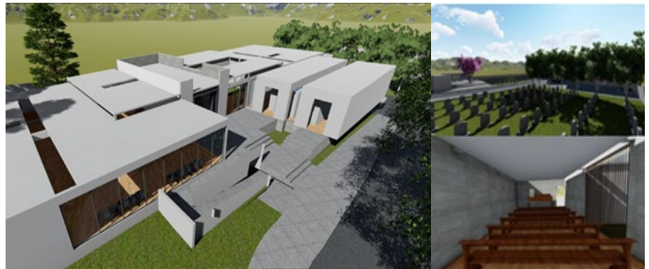
Figura 7. Modelo Renderizado del Cementerio Municipal en Banderilla, Veracruz.