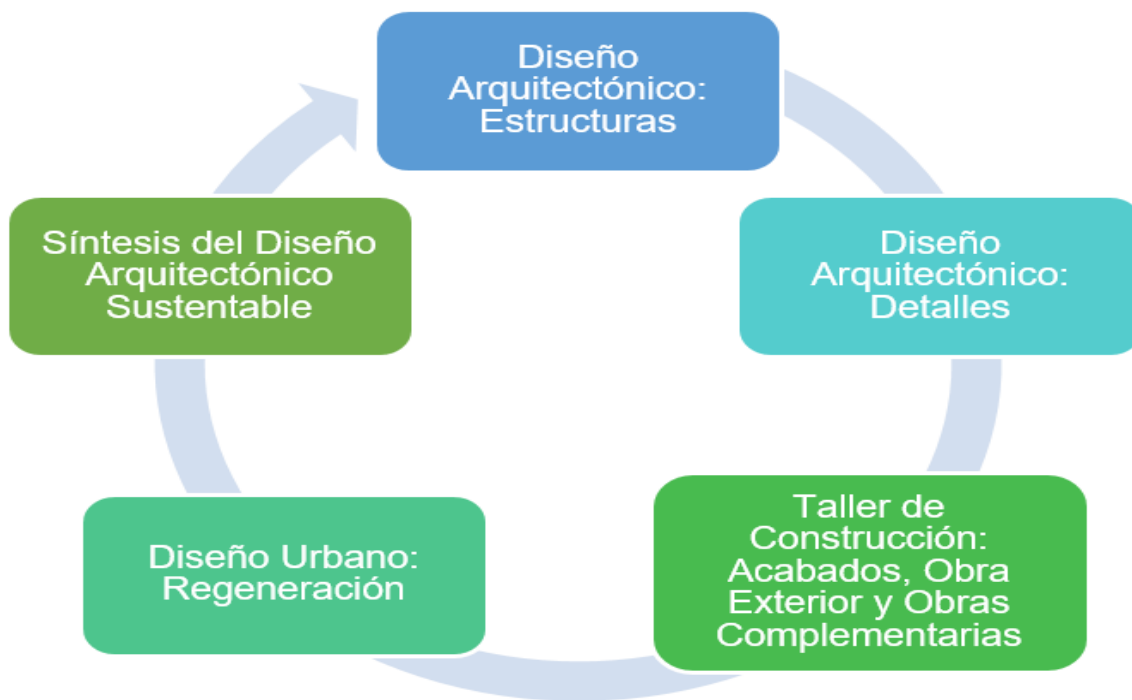
Figura 1. Vinculación EE del Plan de Estudios . Fuente: Elaboración de las autoras. Fuente: Plan de Estudios MEIF 2013. Ver Mapa Curricular https://www.uv.mx/arquitectura/general/mapas-curriculares/

Síntesis del Diseño Arquitectónico Sustentable: El estudiante realiza el proyecto ejecutivo integral que refleja la síntesis de las competencias desarrolladas en los periodos anteriores que le permiten profundizar en el diseño arquitectónico sustentable (UV, Plan de Estudios MEIF, 2013).