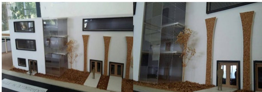
Figura 6. Central de Protección Civil y Bomberos - Maqueta

“La idea de proponer la estación de bomberos surge de acuerdo a la falta de atención rápida ante los sucesos de incendios y/o accidentes; además de la ausencia de un servicio adecuado