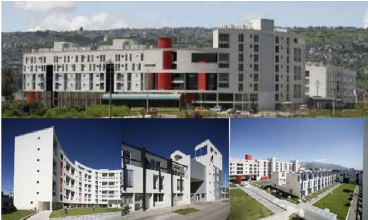
Figura 16. Ciudad de Quitumbe