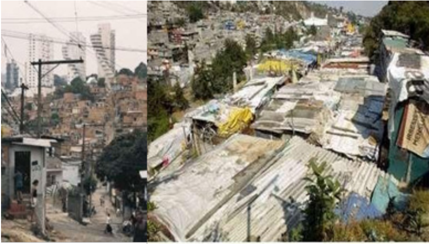
Figura 10. Ciudad de México, asentamientos en la periferia.

La oficina japonesa SAKO Architects ha diseñado un complejo de viviendas en el sur-oeste de Beijing. Son cuatro edificios residenciales, y un edificio comercial. Los edificios residenciales son de 80 metros de altura. Cada dos plantas, se establecen como una sola unidad. Cada unidad está tambaleándose 2 metros en la horizontal, constando todo el edificio con repeticiones de estas unidades. Las áreas posteriores del conjunto se utilizan para terrazas. Unidades en blanco y negro se van entrelazando para destacar la fachada cóncava-convexa y muestran un claro lineamiento de la construcción.