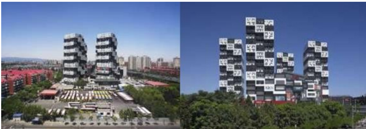
Figura 11. Complejo Habitacional "Bumps" Beijing China.

Se presentan algunos ejemplos de proyectos de gran escala que atienden una problemática metropolitana a nivel de infraestructura, equipamiento