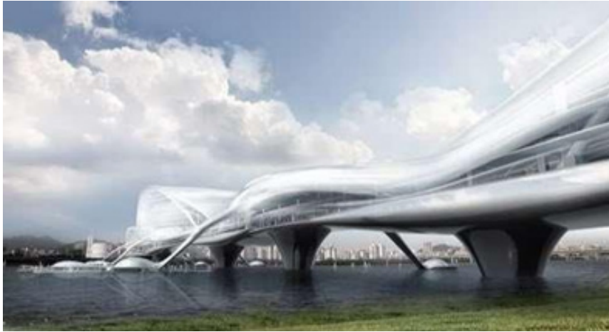
Figura 14. Paik Nam June Media Bridge: mega puente para Seúl