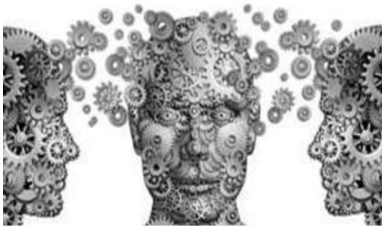
Figura 1. Las incertidumbres: ¿Qué es un paradigma?

más que a unas pocas situaciones muy restringidas y particulares" [Immanuel Wallerstein, 1ro de julio de 2008]