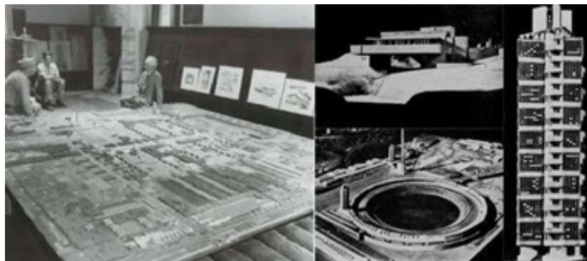
Figura 6. Utopía Broadacre. Izquierda. Frank Lloyd Wright y la maqueta de Broadacre. Derecha. Ciudad Broadacre y modelos arquitectónicos.

entrada, el urbanismo de altura la captación solar, tanto térmica como fotovoltaica, las cubiertas verdes y los aljibes de captación de agua, supone, por un lado, generar buena parte de la energía necesaria del nuevo territorio urbano, y por el otro reducir el consumo de energía por la inercia térmica que tienen el agua y el suelo.