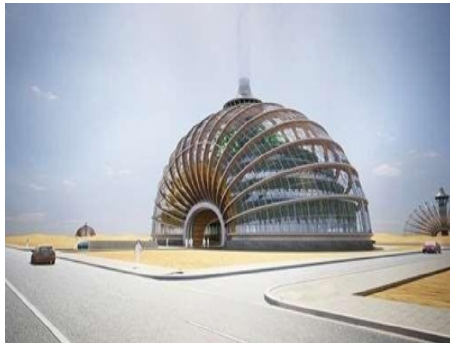
Figura 13. Mega estructura Arca

Paik Nam June Media Bridge es un puente de 1080 metros de longitud sobre el río Han que conectará un espacio público cultural y el edificio de la Asamblea Nacional, que se convertirá en un nuevo hito para la capital surcoreana. El diseño de este megapuerto es