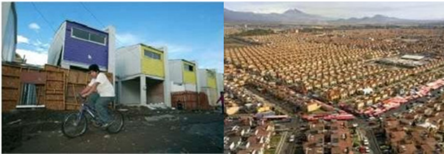
Figura 15. Contrastes urbano habitacionales. Arriba. Barrio piloto. Abajo. Ixtapaluca Ciudad de México desarrollo habitacionales.

Los últimos acercamientos al problema de la vivienda en México parecen dar cuenta de un gran avance en lo que respecta a la naturaleza de la unidad de vivienda en sí misma. La preocupación por el tema por parte del gobierno, las inmobiliarias, instituciones y grupos intelectuales han ido superando problemas básicos, como la indignidad espacial o la incapacidad de crecimiento. Sin embargo, parece que el “avance de viviendas sobre el tejido urbano, está empujando a sus habitantes a nuevas áreas en la periferia de la ciudad, ahí donde los suelos son tan baratos como aislados, en donde prima la cantidad por sobre la calidad y en donde no basta una obra del nuevo arquitecto de