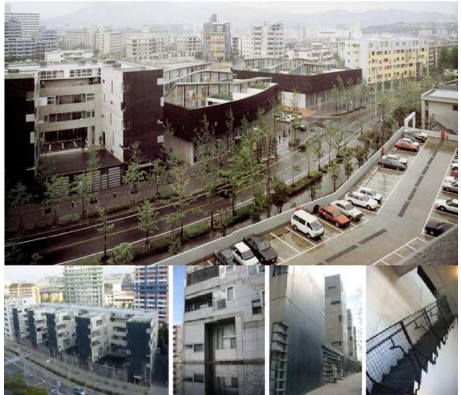
Figura 12. Nexus World. Superior. Vista de los bloques de Rem Koolhaas enfrentando a la calle y definiendo un pasaje peatonal vecinal. Inferior. Collage Bloques de Steven Holl

Dada la geometría inferior del edificio, la estructura se podría construir en cualquier lugar, incluso en regiones de alto riesgo sísmico. También le permitiría flotar, en el supuesto de sufrir inundaciones o subida del nivel de los océanos. Los residuos son utilizados para generar energía.