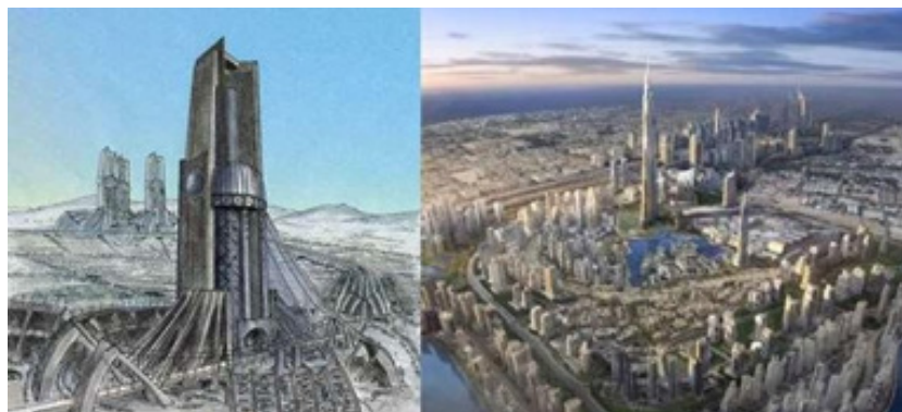
Figura 8. Izquierda. Paolo Soleri. Derecha. Megaciudad futurista DUBAI.

La arquitectura contemporánea comienza en alrededor de los años 70, con el postmodernismo, que pretende responder a las contradicciones de la arquitectura moderna. Esta corriente, busca recuperar las formas del pasado, con la tecnología del presente; trata de solucionar los errores urbanísticos cometidos por el movimiento moderno, pues se ocupaban sólo del problema funcional, abandonando los problemas sociales, económicos y culturales. Así se dan corrientes opuestas y de búsqueda formal que dan sustenta a la arquitectura contemporánea.