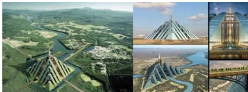
Figura 7. Ziggurat en Dubai.

El control sobre la realidad y la acción colectiva disponen de un sustrato motivacional más fundamentado en la naturaleza humana, más rico y versátil en sus posibilidades. Las sociedades y comunidades organizadas en su base tienen mayores posibilidades de control sobre la realidad, de bienestar personal y colectivo. La participación social incrementa las oportunidades de mejorar la calidad de vida.