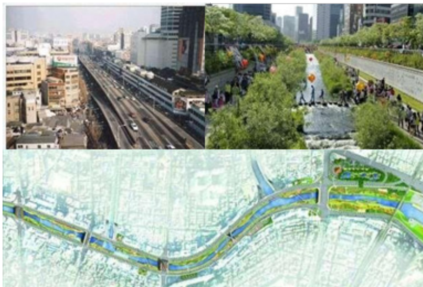
Figura 9. Derecha e izquierda. Cheonggyecheon, Seul. Abajo. Vista aérea Cheonggyecheon, Seul.