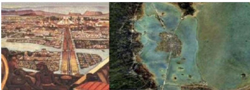
Figura 5. Imaginario Prehispánico y Colonial. Izquierda. La Ciudad de México-Tenochtitlán según la visión de Diego Rivera. Derecha. Ciudad de México en 1510.

entrada, el urbanismo de altura la captación solar, tanto térmica como fotovoltaica, las cubiertas verdes y los aljibes de captación de agua, supone, por un lado, generar buena parte de la energía necesaria del nuevo territorio urbano, y por el otro reducir el consumo de energía por la inercia térmica que tienen el agua y el suelo.