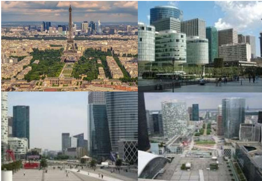
Figura 3. La Défense: área metropolitana de París y la visión urbana arquitectónica de gran escala.

urbano decidido y realizado en 1958, cuyos perfiles son claramente visibles por su arquitectura moderna y vertical. Las escalas y magnitudes dan significados de complejidad y diferenciación de espacios que pueden resultar ciudades dentro de ciudades.