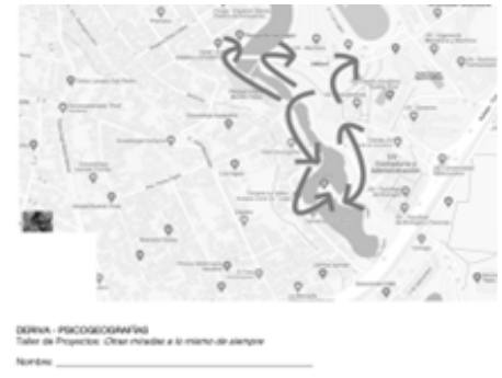
Ilustración 3 Psicogeografía. A la izquierda, The Naked City, Guide Psychogeographic de Paris, 1957 de Guy Debord como elemento inspirador para elaborar la guía turística del taller. Elaboración propia con base en fotografías recuperadas del buscador google y de Francesco Careri (2002, pág. 107)