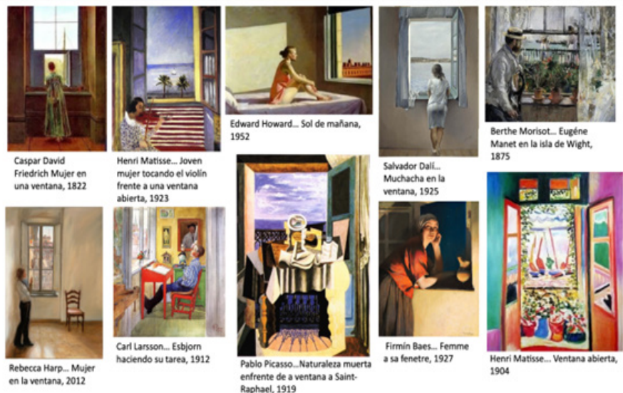
Ilustración 2 La ventana como obra de arte. A lo largo de la historia de la humanidad, el vano ha representado un lugar de encuentro del mirar, del contemplar, del estar... una estructuración de narrativas. Elaboración propia con base en fotografías recuperadas del buscador google.

que en tanto contenido denotativo muy fugaz y conciso, se aborda mediante cuestionamientos explosivos y claro disruptivos, acerca de todos aquellos significados que transmite el vano y qué tan susceptible es a la interpretación dentro del quehacer arquitectónico: ¿Por qué la ventana? ¿Qué implica su