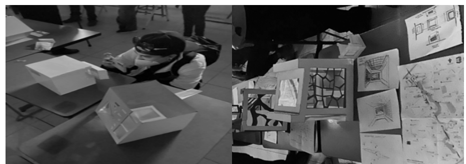
Ilustración 6. Registro del comportamiento

en relación con el programa-evento y mediante estos procesos es capaz de desarrollar, en muy poco tiempo, sus propias versiones de aplicación tecnológica para el mirar, más la "construcción de la luz" en el proyecto. Como ruta pedagógica, se debe recalcar la visualización de cómo se van relacionando todas las etapas de un mismo ejercicio en una estructura,