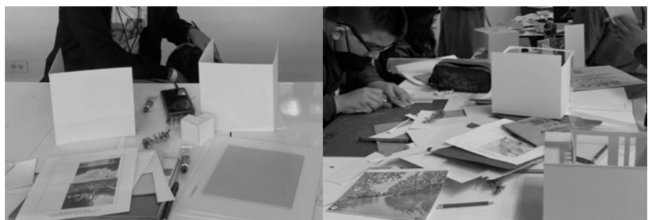
Ilustración 5. Construcción del modelo