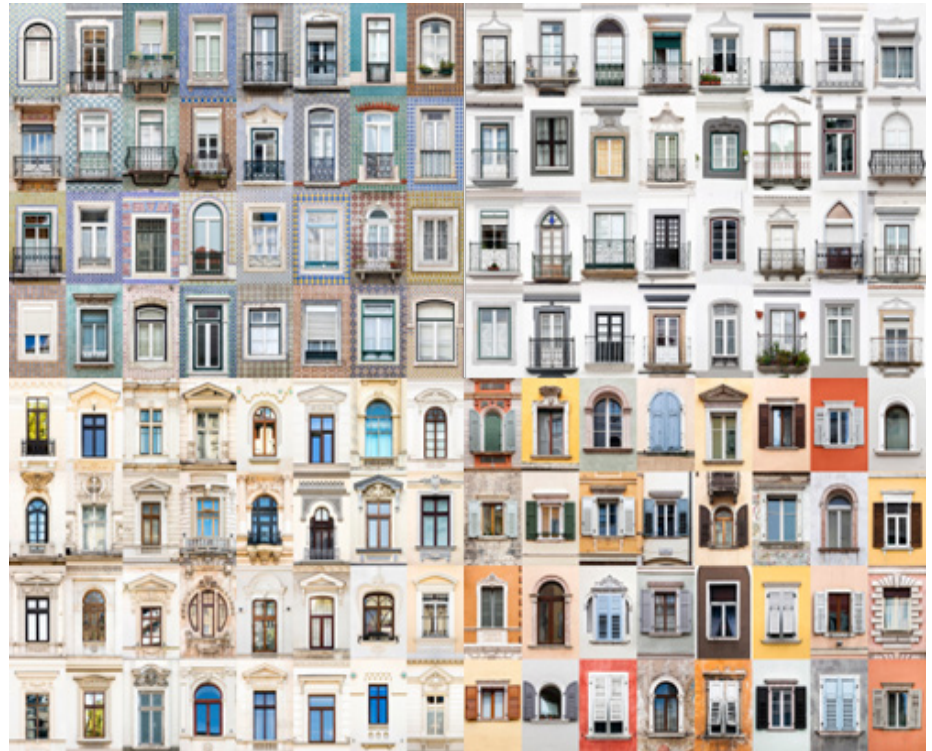
Ilustración 1. Ventanas del Mundo - André Vicente Gonçalves. Hacia la ventana se percibe la expresión de la arquitectura... desde la ventana se percibe el mundo. Elaboración propia con base en las fotografías recuperadas de https://www.archdaily.co/co/781075/ventanas-del-mundo-andre-vicente-goncalves

Con base en estas premisas, el ejercicio inicia con un acercamiento teórico al vano arquitectónico desde la semántica,