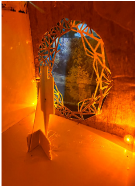
Ilustración 7. Dispositivo para mirar

meditarse como un acto de formación permanente, más allá de cualquier entorno educativo, puesto que en una sociedad tan dirigida y organizada, en la que no hay lugar para la imaginación,