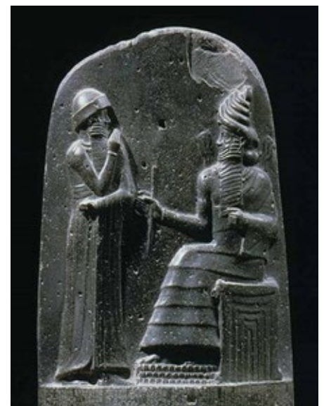
Figura 3.. Jorge Luis Pensado Salazar, Imágenes tomadas de la película alemana – Metrópolis (1927).

Con esto podemos tener una idea de lo que forja a una ciudad, del significado y significación de esta como también de puntos sutiles que marcan el futuro de estas mega entidades. Desde estas mismas perspectivas se debe considerar la ciudad antigua, la ciudad medieval, la ciudad barroca, la ciudad precolombina, la ciudad islámica, la ciudad anglosajona, la ciudad mediterránea, pasando por los asentamientos de obreros en Liverpool (U.K), el estilo americano, hasta las