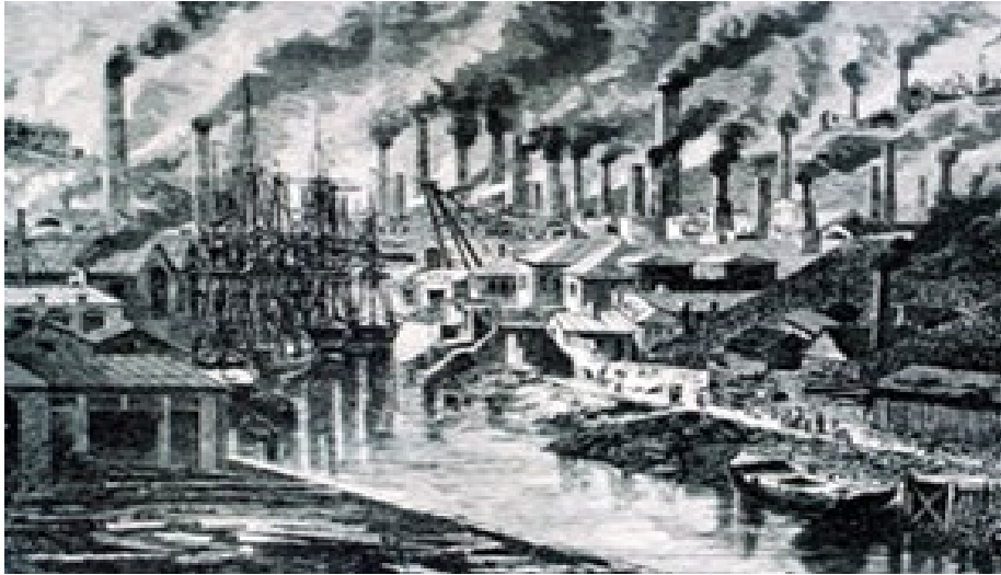
Figura 4. Jorge Luis Pensado Salazar, Imágenes tomadas de la película alemana – Metrópolis (1927).

ciudades contemporáneas y puntos de vista utópicos de la ciudad.