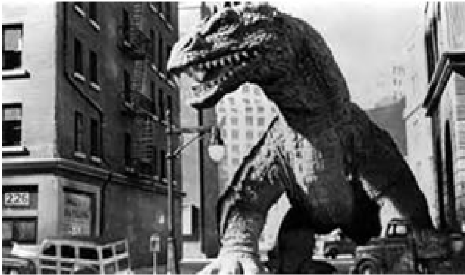
Figura 2. Jorge Luis Pensado Salazar, Imágenes tomadas de la película alemana – Metrópolis (1927).

parte importante del “sistema” que a su vez conforma a esta magna entidad simbiótica que se concibe como ciudad; este “ente” que cobra vida tras la misma vida que se le da. Pero para ser el ente ciclópeo que es ahora y sus métodos de fluidez arcaicos debemos cavar más a fondo y llegar a sus raíces.