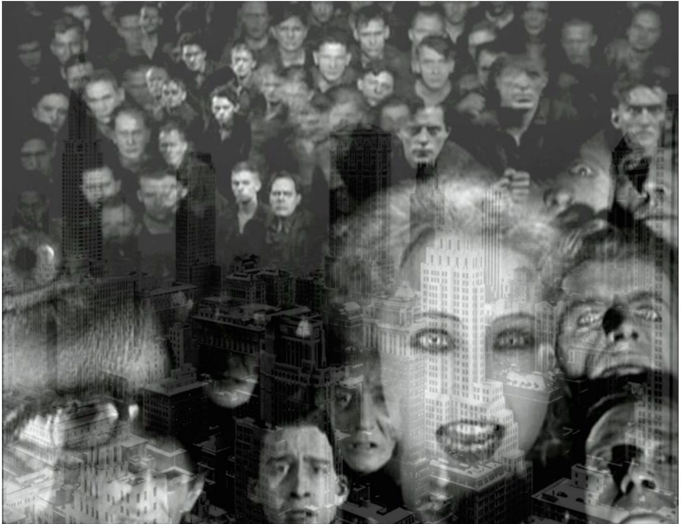
Figura 1. Edición Jorge Luis Pensado Salzar, Imágenes tomadas de la película alemana – Metrópolis (1927).