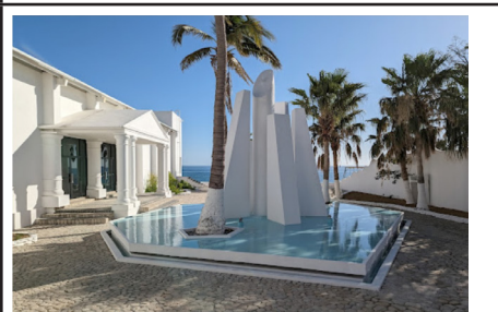
8. Auditorio Muros de Agua, en pueblo mágico Puerto Balleto. Imagen de 2024. Fuente: acervo de la autora