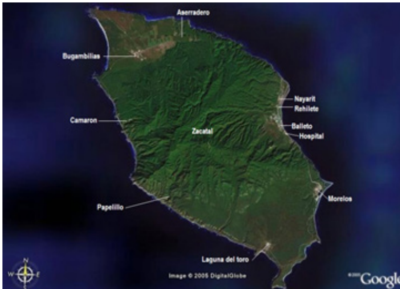
Figura 1. Ubicación de los campamentos de la colonia penal.

en día el Pueblo Mágico Puerto Balleto. Las permanencias arquitectónicas y urbanas de pueblo mágico Puerto Balleto. Esta característica de estudio, se realizó en el pueblo mágico Puerto Balleto, y se localiza en la isla María Madre del archipiélago Islas Marías (figura 3). El archipiélago lo integran tres islas y un islote: María Cleofás, María Magdalena, María Madre y el islote San Juanito, y se localizan en el Océano Pacífico mexicano, frente a las costas del Estado de Nayarit (figura 4). El archipiélago Islas Marías, fue declarado en el año 2000, como Área Natural Protegida, con el carácter de Reserva de la Biosfera; asimismo, este archipiélago fue declarado Patrimonio Natural de la Humanidad en 2005 por la UNESCO, integrado a las islas del Golfo de California, mientras que, en el 2010 Reserva de la Biosfera Islas Marías en adelante.