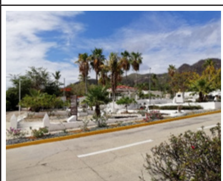
10. Plaza Juárez remozada en pueblo mágico Puerto Balleto. Imagen de 2024.