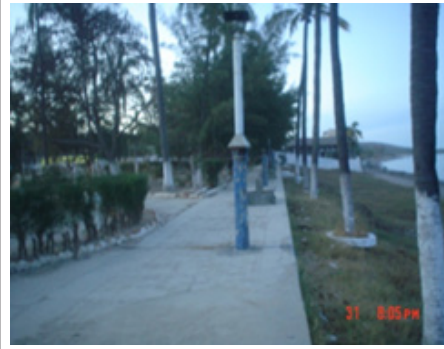
11. Brisa marina: malecón del campamento Balleto. Al fondo, el edificio de la pesquera (hoy restaurant Brisa Marina). Imagen de 2006.