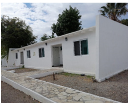
12. Barracas, Casas de visitantes en pueblo Mágico Puerto Balleto. Imagen de 2024.