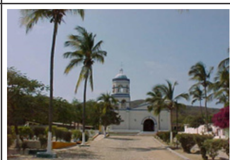
9. Templo de Guadalupe en el campamento Balleto. Imagen de 2005.