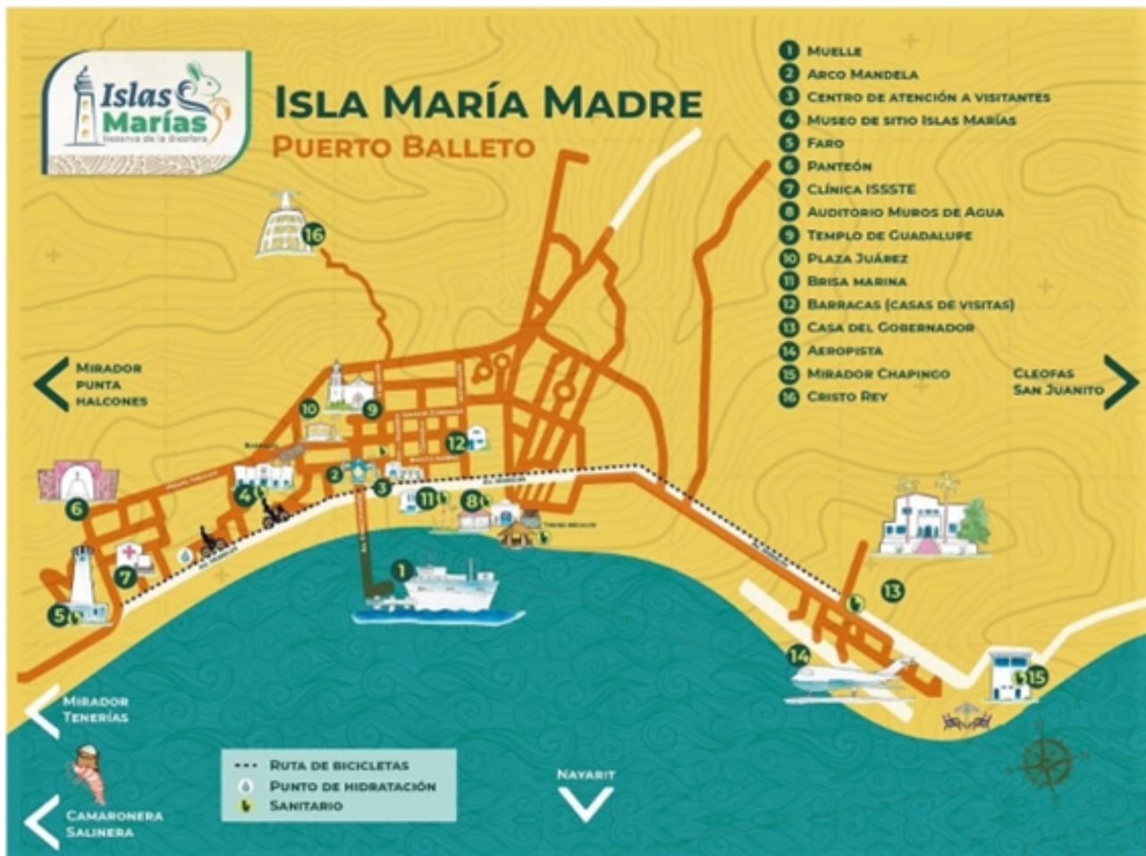
Figura 5. Usos del suelo turístico y cultural del pueblo mágico Puerto Balleto.