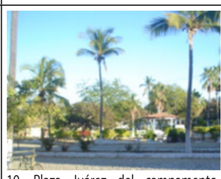
10. Plaza Juárez del campamento Balleto. Imagen de 2006.

y rehabilitadas para uso turístico. No obstante, de acuerdo a las observaciones arquitectónicas realizadas, se identifica el desconocimiento de la cultura material heredada en su función penitenciaria, ya que en las diversas edificaciones no cuentan con información histórica que narren la memoria construida de este lugar; más aún, existe un desconocimiento que las permanencias arquitectónicas asentadas en el conjunto urbano de Puerto Balleto, son un legado histórico de la cultura material edificada de la extinta Colonia Penal Federal y no del Complejo Penitenciario.