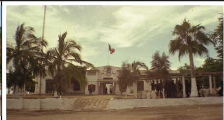
4. Museo de sitio. Cuartel militar de la armada de México, Secretaría de Marina, en el campamento Balleto. Imagen de 2001.