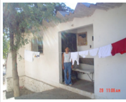
12. Barracas, Casas de visitantes. Señora en el módulo de visita conyugal de interno en el campamento Balleto. Imagen de 2006.