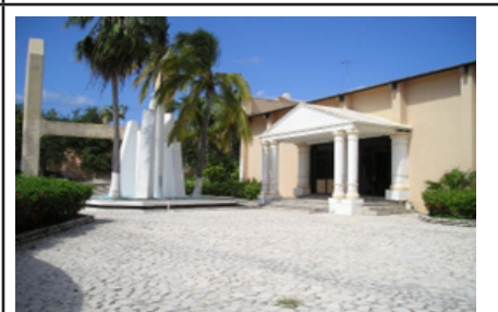
8. Auditorio Muros de Agua. Teatro del Centro Cultural de la colonia penal, ubicado en el campamento Balleto. Imagen de 2005.