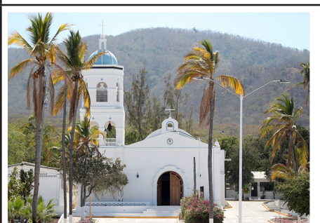
9. Templo de Guadalupe en pueblo mágico Puerto Balleto. Imagen de 2024.