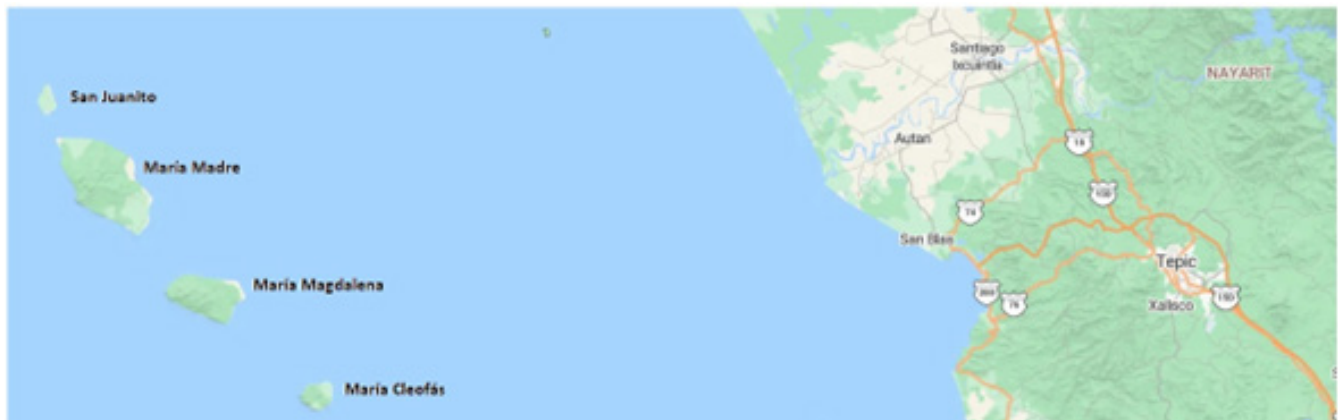
Figura 4. Localización de la Reserva de la Biosfera Islas Marías.

presenta dentro de sus proyectos dos programas: el primero, en 2020 presenta el proyecto del "Centro de Educación Ambiental y Cultural Muros de Agua «José Revueltas»", pero este proyecto no se operó inmediatamente, sino que, se incorpora en el segundo proyecto en 2022, con el proyecto integral de "Centro de recreación turística y cultural de las Islas Marías". Este último proyecto se opera y establece tres elementos claves: a) protección y conservación del área natural protegida, b) Centro