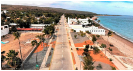
11. Brisa marina: malecón de pueblo mágico Puerto Balleto, al fondo primer edificio, restaurant Brisa Marina.