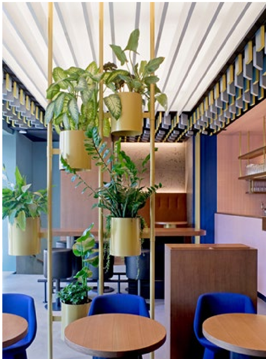
Figura 8. @Ippolito Fleitz Group. Fotógrafo: Andreas J. Focke

En definitiva y a manera no de conclusión sino más bien de apertura a la reflexión, puedo concluir que el acercarse al diseño de espacios con un enfoque diferente al del estudio meramente funcional puede darnos un gran aporte a la reinvención e innovación. Definir entonces la estética y la armonía ya no se vuelve una pregunta que contestar, sino un camino que descubrir.