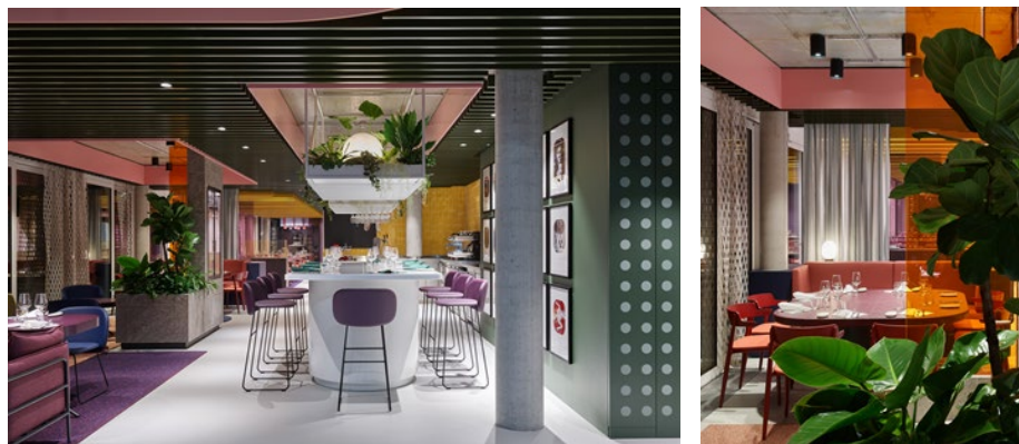
Figura 5 y 6. @lppolito Fleitz Group.

marco de nuestra imagen. Los techos transforman el espacio en un elemento único por que tienen la libertad de convertirse en lo que queramos que sean: pueden ayudar a entender el límite del espacio, crear zonas, balancear las proporciones, y a su vez, también pueden comunicar la identidad de un lugar. Para el edificio de oficinas de un fabricante de pinturas alemanas llamado Wörwag, todo el concepto de diseño se basó en el techo, la inspiración: las paletas abanico de colores de la gama de productos de la empresa. Techos coloridos inclinados en forma de zigzag extendidos a través de los tres pisos acristalados de oficinas hacen la identidad tangible resaltando