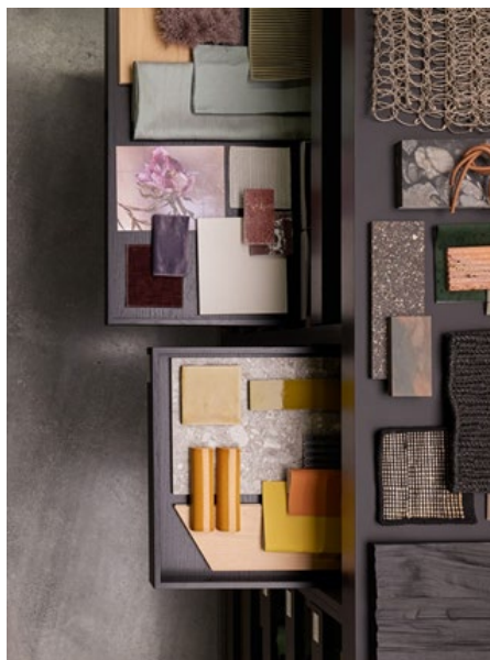
Figura 4. @lppolito Fleitz Group.

las mesas hasta la porosidad de la piedra de los cubos de vegetación. Cortinas semitransparentes con patrones de geometría amplificada y puntos grises como gráficos en la pared hacen del espacio aún más rico en texturas.