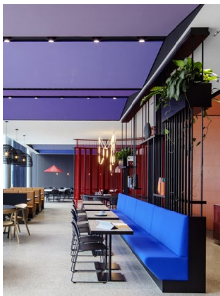
Figura 7. @Ippolito Fleitz Group. Fotógrafo: Eric Laignel

Alemania. De día, nuestra intención fue representar la energía vibrante de la zona, de noche, un ambiente más íntimo y sofisticado. La solución radicó en la plasticidad del techo: elementos rectangulares multidimensionales con colores vibrantes que asemejan los colores de las fachadas de los edificios de la zona para hacer eco con la energía del lugar durante el día; y un techo homogéneo en la mitad del espacio con una iluminación regulable para el cambio de atmósfera: iluminación cálida y suave por la noche para dar un sentimiento acogedor en la noche.