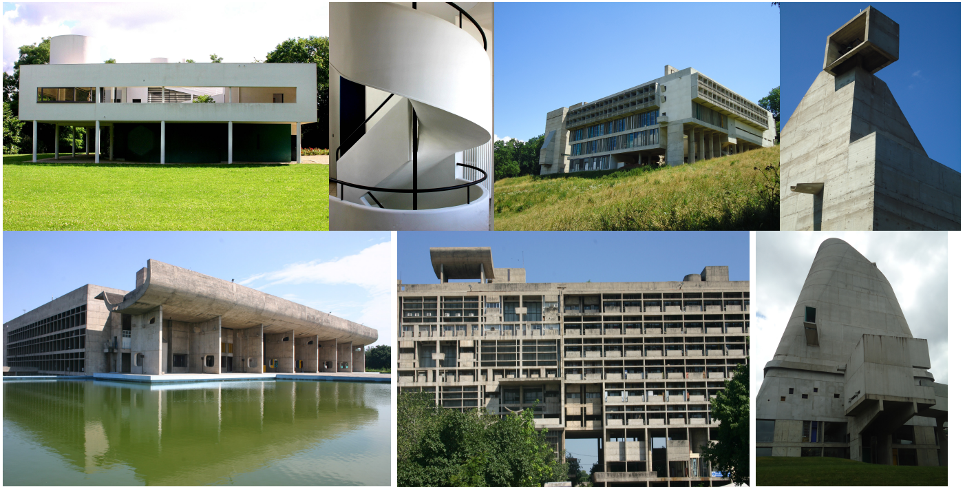
2. En atención a su importancia, 17 obras de Le Corbusier - como la Villa Savoie, La Tourette, Chandigarj y San Pedro en Firminy- fueron, en 2016, declaradas Patrimonio de la Humanidad por la UNESCO.

su admiración por Palladio y, en forma destacada, por la Acrópolis de la Grecia Clásica a la que le dedicó muchas páginas de su mítico libro, Hacia una arquitectura (Le Corbusier, 1988:161-183) y en donde aprendió uno de sus conceptos básicos de diseño arquitectónico, el de la promenade , paseo o recorrido para poder experimentar cabalmente la arquitectura.