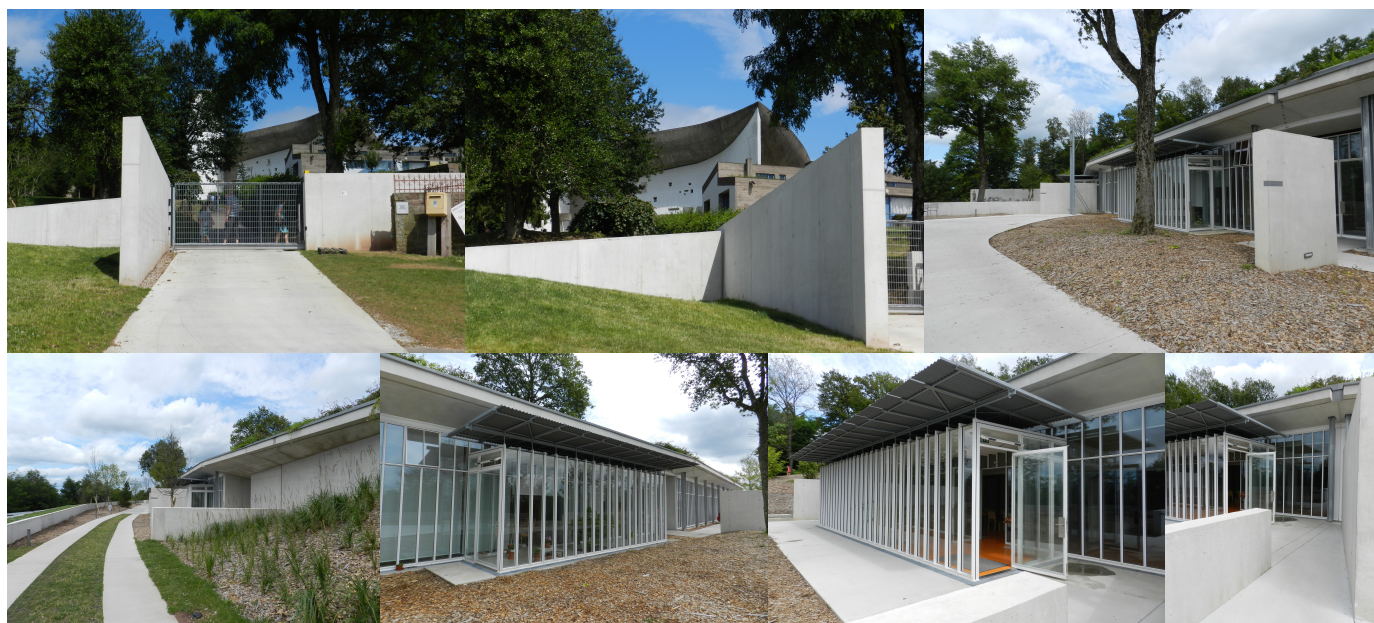
6. Parte visible de la nueva Portería, el Centro de Visitantes y el Monasterio diseñadas por Piano.

elementos duplicando su distancia a la capilla con respecto a la primera propuesta (Richard Ingersoll), logrando, finalmente, su aprobación general que se vio reforzada cuando, una vez terminada la intervención en el 2011, se pudo constatar que, desde la parte superior de la colina en que se asienta la obra corbusiana, la nueva obra pasaba totalmente desapercibida; invisibilidad lograda tanto por la construcción semienterrada del monasterio en la ladera de la colina (Santiago de Molina) como por, -repetiendo el recurso usado ahí mismo por Le Corbusier en las construcciones adyacentes a la capilla- cubrir las cubiertas de la nueva obra con hierba (Inés Lalueza). El lado opuesto a la ladera, en cambio, se abre por completo al paisaje pero incluso esa parte, la visible , es sumamente discreta y contenida, predominando en sus acabados los planos blancos de concreto y el aluminio de los ventanales. El nuevo acceso, finalmente, eliminó un antiguo y muy desafortunado agregado que impedía, al inicio del ascenso, la vista de la capilla en lo alto de la colina, estando trabajado con una muy limpia reja - que no bloquea la perspectiva- confinada entre dos planos que se prolongan hacia un costado conectando