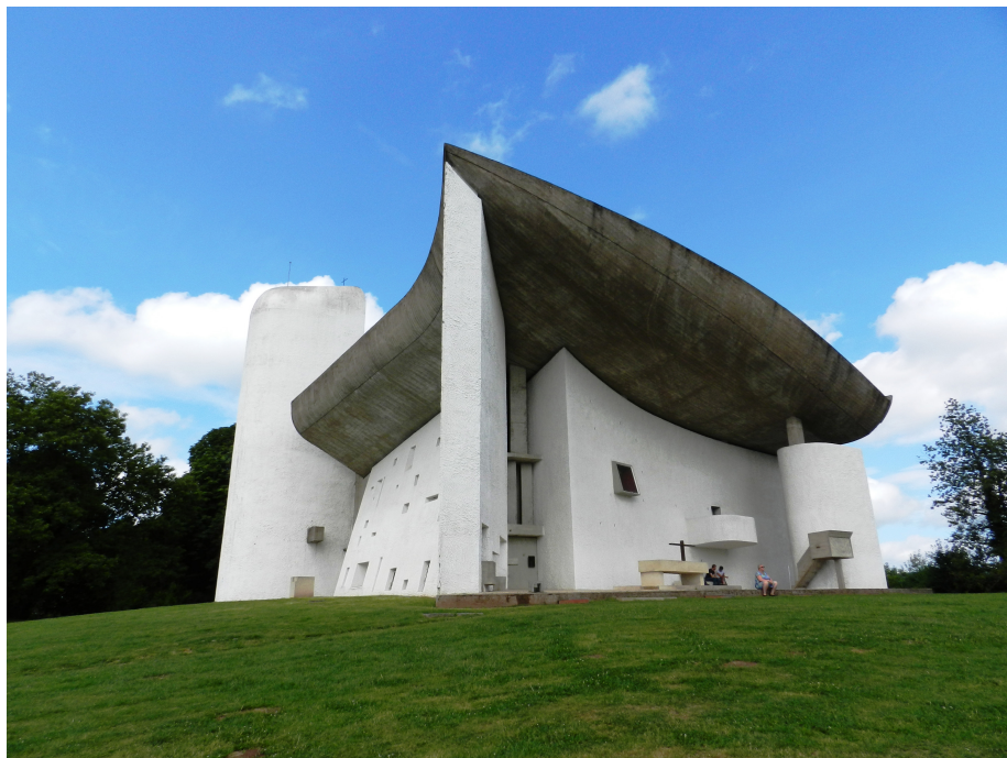
Fotografía 1. Perspectiva de la Capilla Notre Dame du Haut Ronchamp, Francia.