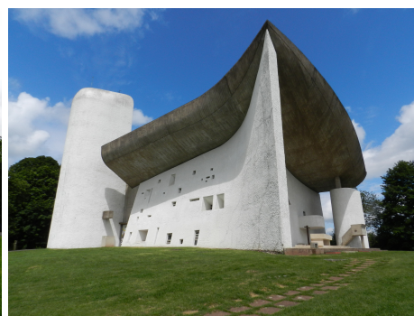
3. El carácter único de Ronchamp responde a las condiciones específicas y muy particulares tanto del programa como del sitio, aunque fue por algunos considerada como desviación del funcionalismo de Corbu.