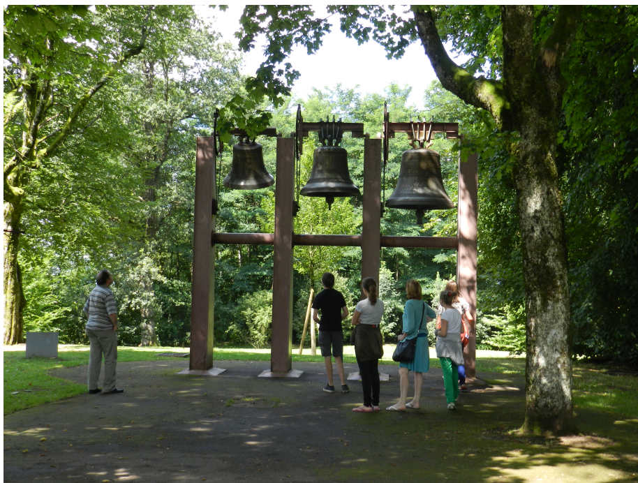
5. Como el gran maestro que era, Jean Prouvé comprendió que su campanario debía estar oculto para, en su silencia visual , no molestar o afectar a la obra de su amigo Le Corbusier.

obra que ubicó cerca del lado este de la capilla, oculta porque, según declaró: «No se puede poner algo estúpido al lado de la obra de Corbu, no se puede dar el tono equivocado» 7 (Carla Maher).