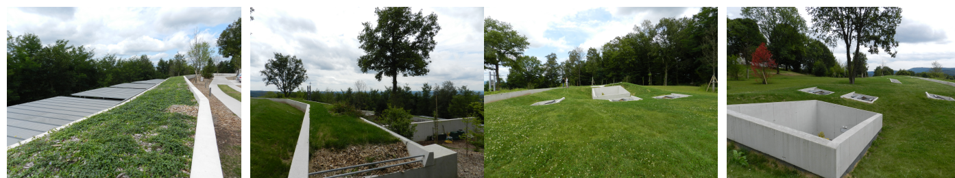
7. El paisajismo de Corajoud se limitó, sabiamente, a cubrir de pasto la obra nueva ubicando cuidadosamente algunos acentos -árboles incluidos - siempre pensados en función de la armonía de todos los elementos.

a nivel mundial, en un gran número de exposiciones antológicas de su obra 19 . En Ronchamp, evidentemente, con distintos requerimientos y en diferentes épocas 20 , se dieron cita tres grandes maestros de la arquitectura contemporánea. Valga recordar la frase en que Valery, marcando la enorme diferencia entre las muy contadas arquitecturas de calidad que son las que cantan, por contraste, a la gran cantidad de obras mediocres o francamente malas, las consideraba mudas . 21 Cabe aclarar que en el armonioso conjunto de Ronchamp, todas las obras son de calidad pero no todas cantan, y no es porque sean mudas . Lo que pasa es que, tanto el campanario de Prouvé como el convento y portería de Piano, guardan silencio para no disturbar el bello canto de la capilla, excelente ejemplo de humildad y sabiduría en que ambos, tanto Prouvé como Piano, supieron que, ante la insuperable obra de Le Corbusier, lo indicado y correcto, era callar .