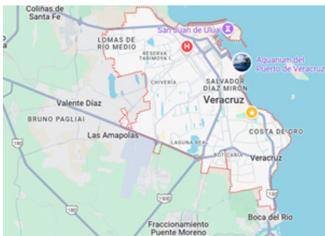
Figura 3. Google Earth. (2024). Ciudad de Veracruz, coordenadas 19.1025° N, -96.0803° W. Disponible en https://earth.google.com/

Las observaciones de campo confirman que en las zonas periféricas predominan espacios públicos en condiciones de deterioro. Aproximadamente un 42% de los parques y canchas comunitarias presentan áreas descuidadas, con