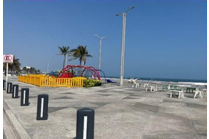
Figura 5. Áreas de esparcimiento. Veracruz Puerto. Autores (2024).

de áreas verdes reducen la frecuencia de uso por parte de la comunidad. En algunos casos, lotes baldíos que deberían servir como áreas comunes fueron ocupados de manera irregular o permanecen en desuso, lo que refuerza la fragmentación social y territorial.