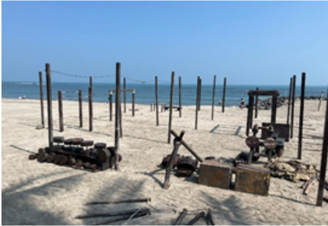
Figura 8. Gimnasio al aire libre – Playa, Veracruz Puerto.

estos proyectos terminan subutilizados, ya sea porque no se ajustan a las prácticas cotidianas de los habitantes, o porque carecen de mantenimiento y vigilancia.