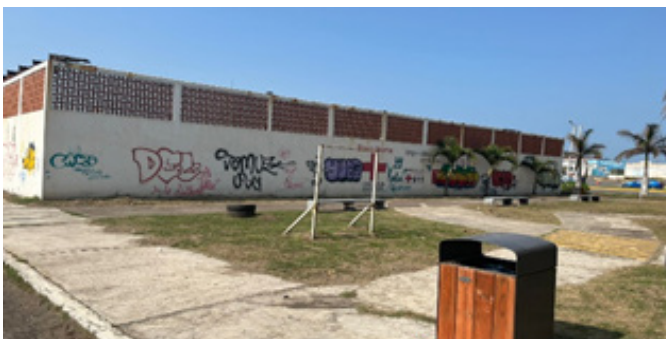
Figura 9. Área de esparcimiento, Veracruz hacia la Periferia.

Para avanzar hacia una gestión más equitativa, resulta necesario repensar el papel del espacio público como un derecho ciudadano y no únicamente como recurso de atracción turística o comercial. Esto implica el diseño de políticas urbanas que incorporen obligatoriamente procesos de participación comunitaria en cada etapa del proyecto: diagnóstico, diseño, implementación y evaluación. Herramientas como los presupuestos participativos barriales, los consejos ciudadanos de planeación o las metodologías de urbanismo táctico representan vías factibles para fortalecer la apropiación comunitaria y garantizar que los espacios públicos respondan a las necesidades reales de la población. (Figura 9).