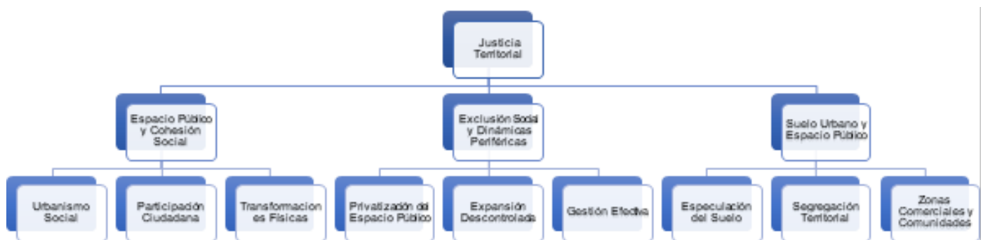
Figura 1. Justicia Territorial: Directrices.

Mencionar el espacio público es incluir un elemento básico en la construcción de la cohesión social y la participación comunitaria, donde Lebevre (1974) sostiene que el espacio no es solo un contenedor neutro, sino una producción social en la que se reflejan relaciones de poder, convirtiéndose así el mismo en un escenario donde las dinámicas sociales, económicas y políticas suelen manifestarse, con lo cual se