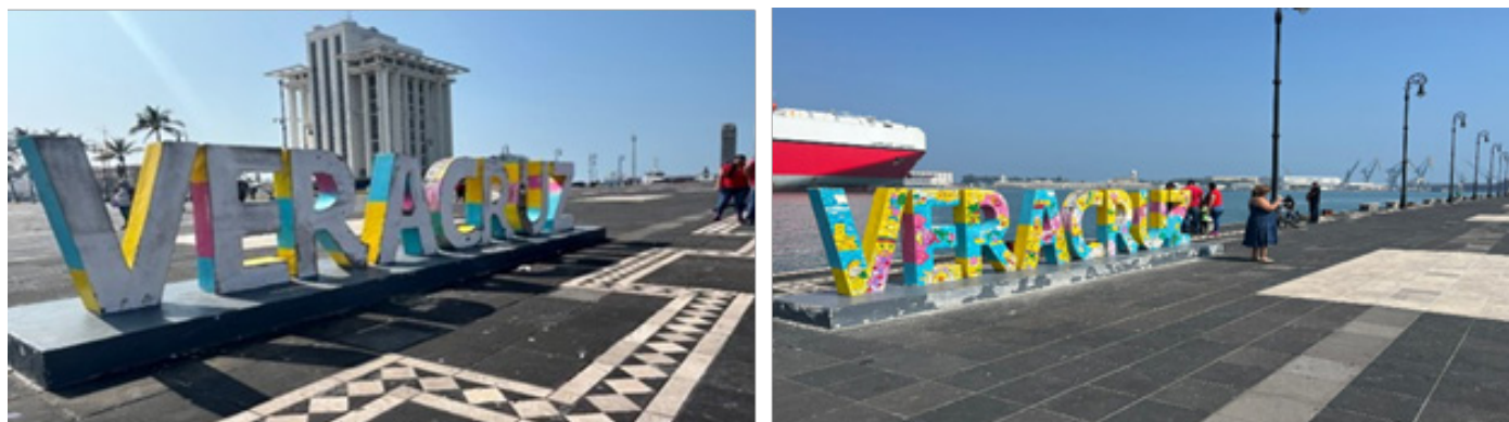
Figura 4. Contradictorio Urbano. Letrero turístico Veracruz, Autores (2024). Las imágenes son una clara referencia al aspecto que se vive realmente, evidencia que, a los ojos de los turistas, es un Veracruz con una semejanza acorde a su imagen urbana y espacios públicos limpios; mientras que la imagen de la izquierda esconde por detrás todo lo que realmente existe, un Veracruz con espacios en abandono y segregación, sin "color".

Otro hallazgo relevante es la fragmentación y desconexión entre los espacios públicos existentes. Se identificaron casos en los que los parques o canchas se encuentran aislados, rodeados de vialidades sin cruces peatonales o sin rutas de transporte accesibles, lo que refuerza la segregación territorial. Esta situación coincide con lo planteado por Sassen