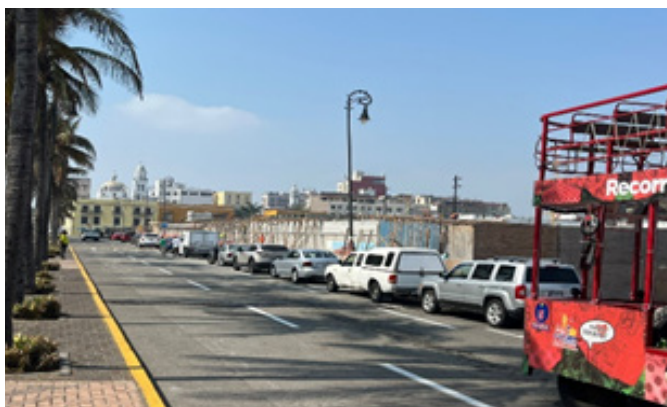
Figura 7. Portales, Mercado de Artesanías, Centro Histórico de Veracruz Puerto. Autores (2024).

Durante los recorridos y observaciones en campo se constató que, mientras las áreas céntricas y turísticas presentan espacios públicos con infraestructura renovada, iluminación adecuada y presencia de vigilancia, en colonias periféricas se identificaron múltiples espacios abandonados, con mobiliario deteriorado y escasa seguridad (Figura 7). Esta diferencia muestra cómo los proyectos de inversión en infraestructura tienden a privilegiar el turismo, relegando a segundo plano las necesidades de las comunidades locales.