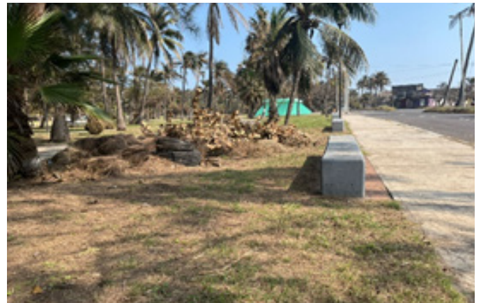
Figura 10. Habitabilidad. Seguridad e Higiene, Veracruz hacia la Periferia. Autores (2024).

El análisis realizado permite concluir que la ciudad de Veracruz enfrenta una profunda desigualdad territorial en la distribución y funcionalidad de sus espacios públicos. Mientras que las zonas céntricas y turísticas concentran infraestructura de calidad, asociada al turismo y a la proyección económica de la ciudad, las colonias periféricas continúan marcadas por la precariedad, el abandono y la falta de planificación. Esta disparidad refleja no solo una brecha material, sino también una fractura social que limita la cohesión comunitaria y refuerza dinámicas de exclusión. (Figura 10).