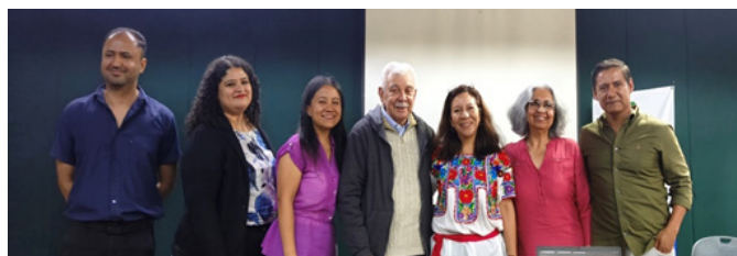
Figura 2 Participantes egresados del conversatorio sobre "Investigaciones de posgrado sobre Patrimonio Arquitectónico Cultural". 20 de abril de 2026.

Durante el mes de abril del 2026, con motivo del Día Internacional de Monumentos y Sitios se efectuó un conversatorio con algunos de los egresados del programa. En este evento se tuvo la oportunidad de conocer las experiencias de algunos de ellos cuyas tesis se mencionaron en los resúmenes. De su propia voz en este documento se incluyen a los egresados que participaron en el Conversatorio titulado "Investigaciones de posgrado sobre Patrimonio Arquitectónico Cultural".