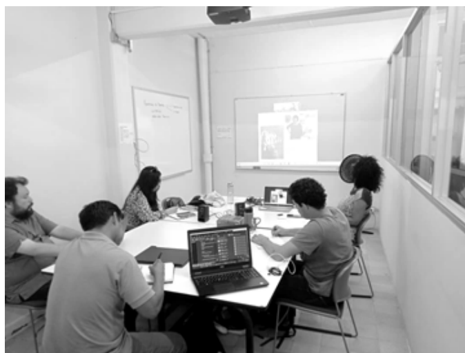
Figuras 4. Sesión del laboratorio en el Seminario Interseccional y Arquitecturas No Hegemónicas (2025).

El cuerpo del y la investigadora deja de ser un velo invisible y se reconoce como el primer instrumento de registro fenomenológico. Al encarnar la mirada, el estudiantado de