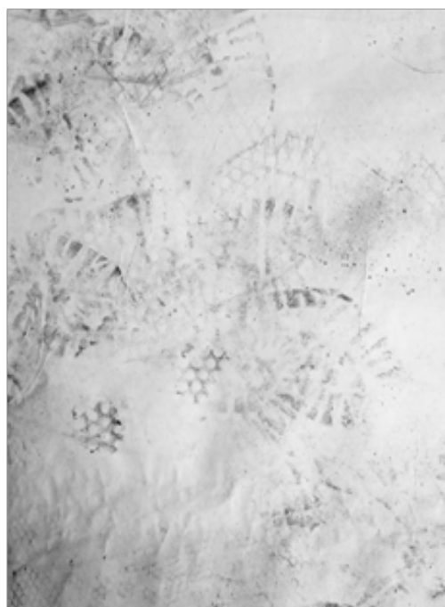
Figuras 2 y 3. Experimentaciones y representaciones.