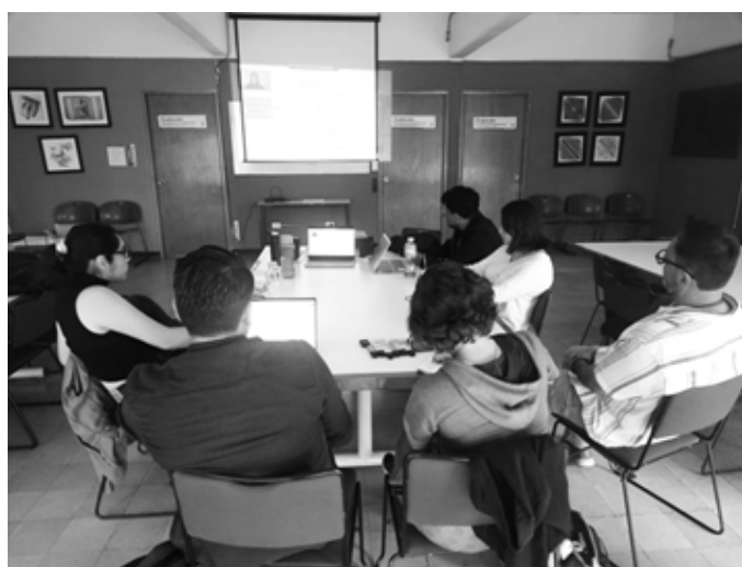
Figuras 5. Sesión del laboratorio en el Seminario Interseccional y Arquitecturas No Hegemónicas (2024).