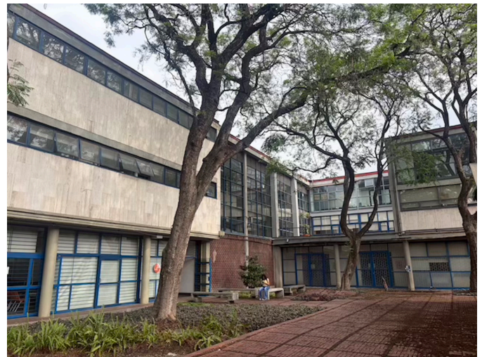
Figura 6. Anexo de la facultad de Arquitectura, Antigua Unidad de Posgrado: Fotografía: ACP, 2026.

Básicamente fueron tres factores los que propiciaron la renovación de la estructura del Programa de Posgrado, primero la consideración académica, ya que en ese momento se consideró que los planes de estudio tenían una "estructura muy rígida, con una carga académica de corte informativo en detrimento de las actividades de aplicación a la investigación" (Plan de Estudios de Posgrado En Arquitectura, p. 6). La consideración de actualización, lo que se dio con la creación de las licenciaturas en Arquitectura de Paisaje y en Urbanismo,