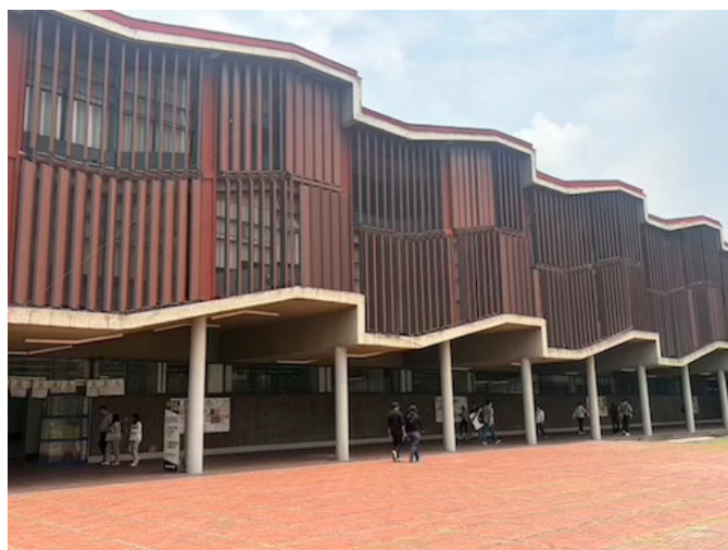
Figura 8. Antiguo posgrado de Arquitectura, Campus Central. Fotografía: ACP, 2026.

Siendo rector el Dr. José Narro Robles, como parte del Plan de Desarrollo Institucional 2011-2015, se propuso realizar una reforma al Reglamento General de Estudios de Posgrado, que derivó en la reorganización, estructura y normativa que generó una independencia administrativa de las entidades académicas a nivel de licenciatura.