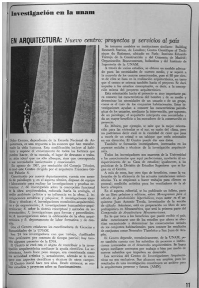
Figura 2. Nuevo centro, proyectos y servicios al país.