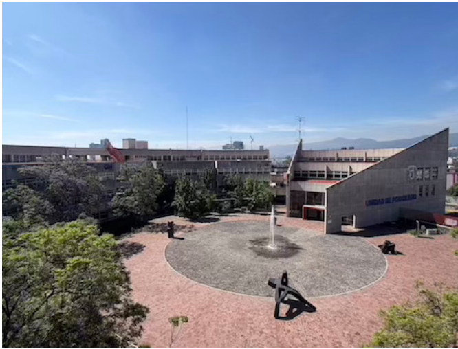
Figura 9. Unidad de Posgrado, Fotografía: ACP, 2026.

sus entidades académicas, ya que será la CGEP la responsable de la revisión técnica y normativa de los procesos de selección e ingreso a los programas de posgrado de la universidad.