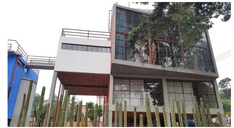
Figura 3: Exterior Casa Estudio de Diego Rivera diseñada por O'Gorman. Elaboración propia: fotografía de Carmen E. Gómez)

O'Gorman evolucionó, dando un giro completo a sus ideales y se convirtió en el defensor de la arquitectura orgánica y fantástica, que se caracteriza, por el uso de formas inspiradas en la naturaleza con el empleo pionero de piedras naturales de colores "...consideraba que su obra arquitectónica abría paso a una nueva corriente en México, ya que el funcionalismo... que se limitaba a aplicar unas cuantas fórmulas, se había convertido en una nueva academia, que era necesario combatir 2 " Resultaron de este nuevo credo de O' Gorman: la Biblioteca del campus de la Universidad Nacional (1949-1950, donde se realizó el mural de mosaico más grande del mundo); el Museo Anahuacalli (1956) construido en colaboración con Diego Rivera y su hija la arquitecta Ruth, así como su propia casa —la llamada Casa Cueva o Casa Orgánica (1953)—. Aún así, el legado funcionalista de O'Gorman quedó para la posteridad, como señaló Silvia Arango, al referirse a la llegada de la modernidad a México: "...en la historiografía arquitectónica latinoamericana han sido destacados como gestos pioneros algunas casas mexicanas, como las cuatro que construyó Juan O'Gorman entre 1929 y 1932" 3