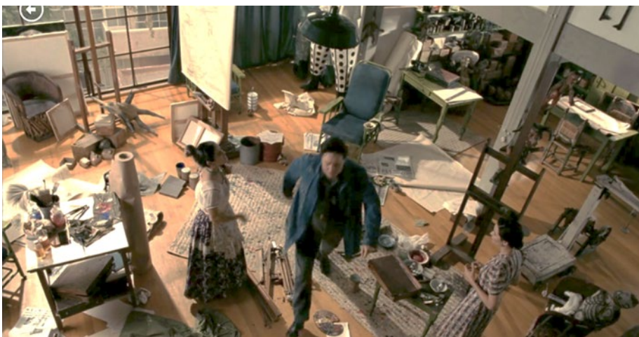
Figura 8: Interior del estudio de Diego Rivera (fotograma del largometraje Frida (2002))

Esta cinta exhibe además, los exteriores de estas casas estudio, en una arriesgada escena cuando Diego intenta llegar a la casa de Frida por medio de la escalera externa de escalones volados. Es de noche y el corpulento físico del actor en esos enjutos escalones hace temer que pueda caer. De nuevo se juega efectivamente con la escala y los espacios para albergar las emociones de los actores. En otras escenas se ven las casas desde la calle de enfrente y en una más se muestra el uso de la azotea, que bien puede servir para usos utilitarios, como tender la ropa o para socializar, al modo en que lo planteó Le Corbusier para algunas de sus viviendas. Por lo anterior, se puede señalar que a pesar de que esta cinta tiene un estilo más convencional en su narrativa y no llega a considerarse una obra de arte cinematográfico, pero sí debe tomarse en cuenta, que no se desaprovecha el uso de las locaciones reales. Mientras el filme de Leduc pasó a la historia del cine mexicano como uno de los mejores de los años 80 por el estilo contemplativo con que fue filmado y por la riqueza de intertextos que aluden a la cultura mexicana de los años 40 y 50 del siglo XX, el filme de Taymor-Hayek ofrece otras contribuciones, entre ellas el permitirnos observar con detalle