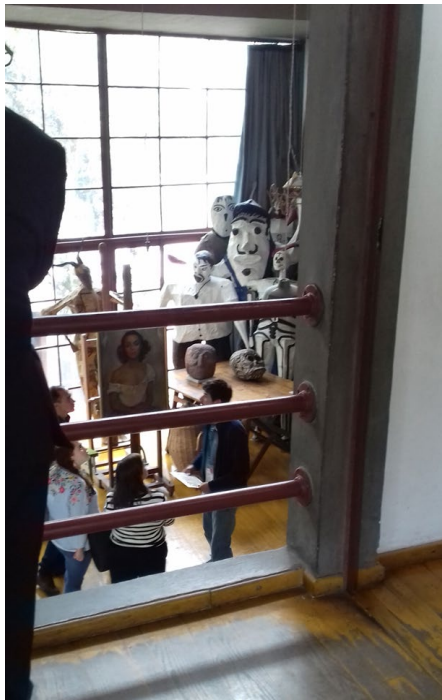
Figura 4: Interior del estudio de Diego Rivera