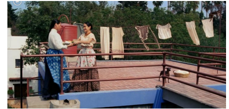
Figura 9: Azotea del estudio de Frida Kahlo (fotograma del largometraje Frida (2002))

espacio se ve saturado, pues la colección que hoy forma parte de esta Casa Estudio Museo es muy amplia y el espacio es pequeño. Sin embargo, en este filme se juega con la escala y se muestran también, los ventanales de doble altura y de nuevo el muro de ladrillos rojos.