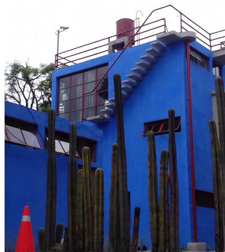
Figura 2: Exterior de la Casa Estudio de Frida Kahlo diseñada por O'Gorman.