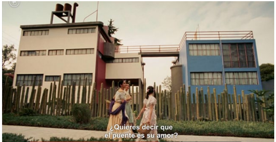
Figura 5: Exterior de las casas estudio de Diego Rivera y Frida Kahlo, de derecha a izquierda (fotograma del largometraje Frida (2002))

Los reconocidos pintores nacionalistas, Diego Rivera y Frida Kahlo, tenían temáticas y estilos bien diferenciados, Rivera fue uno de los más relevantes muralistas del siglo XX en México, y Kahlo, autora de obras de pequeño formato de fuerte expresión autobiográfica. Sin embargo, ambos además, disfrutaban de otros estilos artísticos como fueron las vanguardias. De joven Diego Rivera se nutrió del cosmopolitismo, vivió en Europa entre 1907 y 1921 donde aprendió diferentes estilos pictóricos, incluso llegando a practicar el cubismo (1915), durante su estancia conoció a André Breton, a Le Corbusier y al Sergei Eisenten (cineasta ruso). Por lo cual no es de extrañar que años después en México, Rivera y Kahlo (1907 -1954) acogieran con agrado los diseños funcionalistas que Juan O’Gorman propuso para su futuro hogar en 1931, pues estaban al día en las tendencias progresistas del arte. Además de que, al arquitecto los unía la práctica de la pintura nacionalista